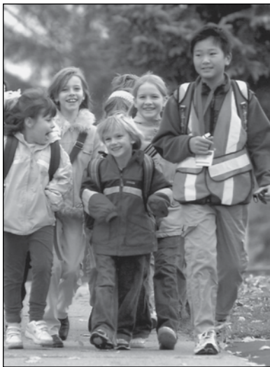
—Westvale Trailblazers, Westvale Public School, Waterloo, Ontario

Le conseil de parents de la Westvale Public School à Waterloo, en Ontario, a créé un pédibus novateur, qui est « conduit » par des enfants plus âgés. Ces élèves, appelés « Trailblazers » reçoivent une formation, ainsi que des gilets et des sifflets, donnés par le conseil de parents. Les parents, hésitants au départ, sont maintenant ravis des nouvelles responsabilités des élèves et du fait que ceux-ci respirent l'air pur et font de l'exercice.