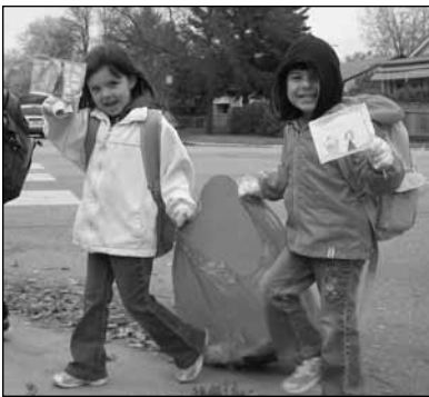
—Stevenson School (Winnipeg)