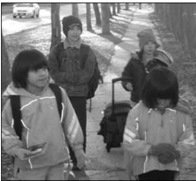
—Ruth Hooker School (Selkirk)